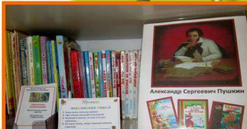
Литературный центр «Здравствуй, книжка»