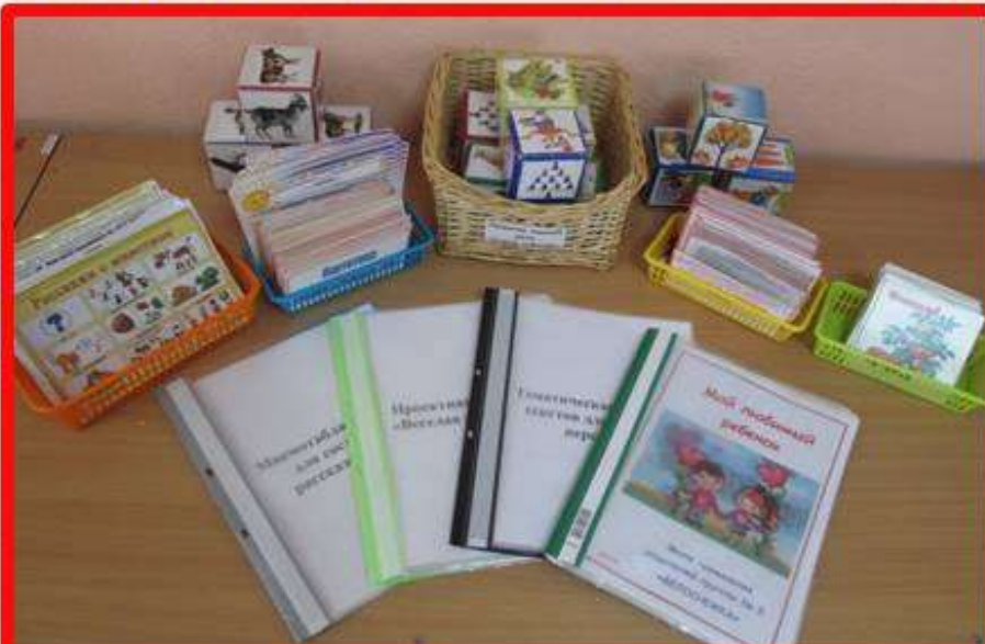
Пособия для развития речевого творчества